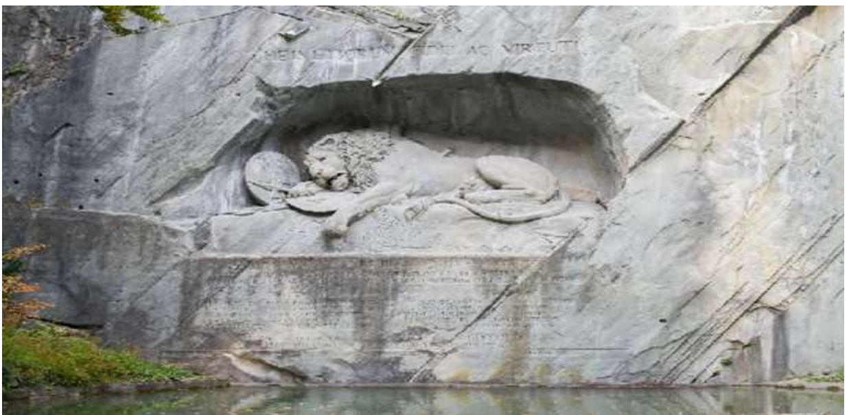
นำท่านข้ามพรมแดนสวิตเซอร์แลนด์ – อิตาลี